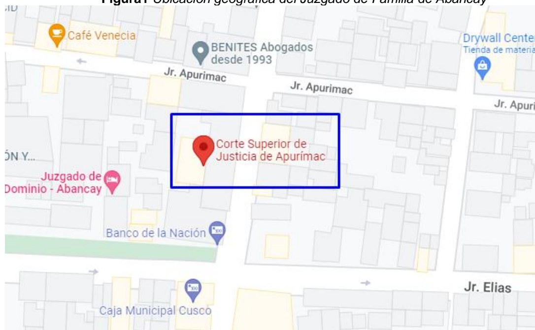
Figura1 Ubicación geográfica del Juzgado de Familia de Abancay

Esta investigación se desarrolló en el Juzgado de Familia de Abancay, la misma que es una de las siete provincias del departamento de Apurímac y el Juzgado de Familia de Abancay está ubicado en la Av. Díaz Bárcenas N° 100.