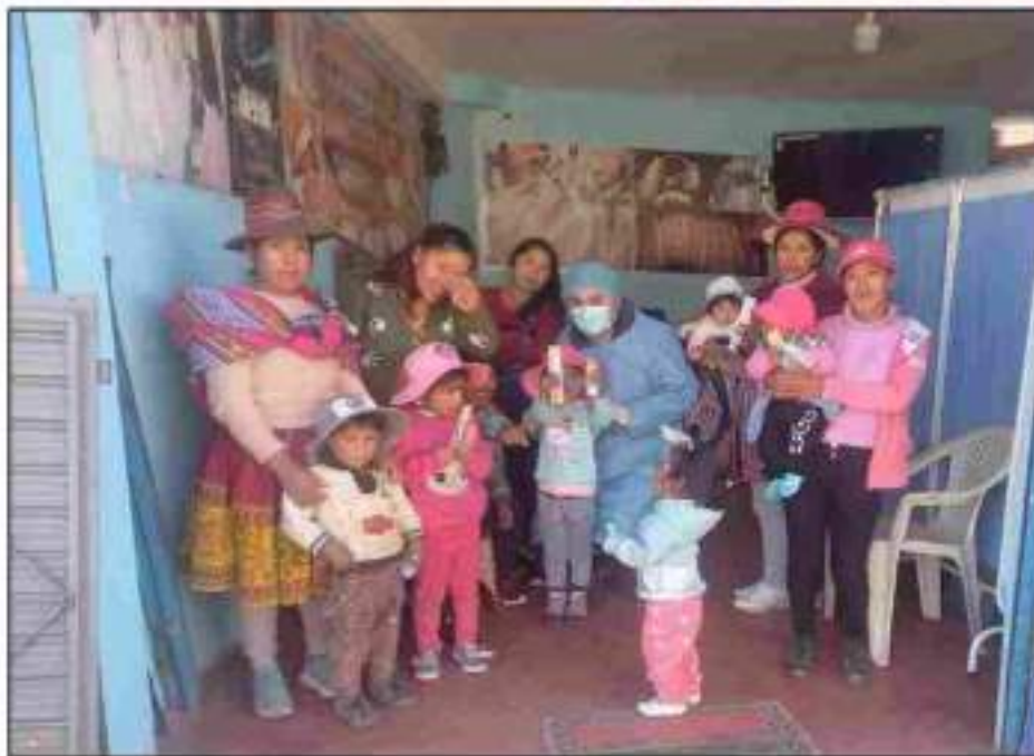
Agradecimiento a los padres de familia, más entrega de cepillos y pastas dentales