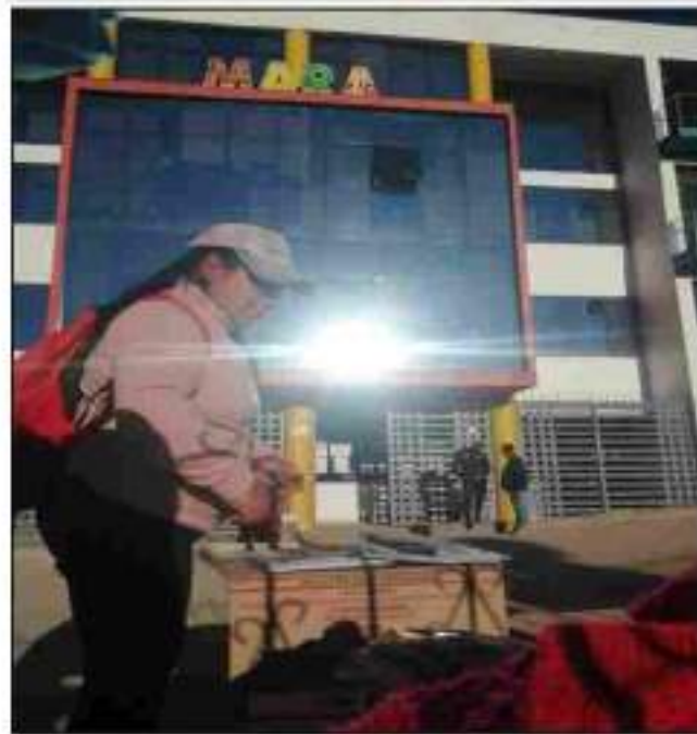
Repartición y distribución de Productos a fueros de la municipalidad de Mara y Campaña donde se dio a conocer y promover el motivo de nuestro trabajo