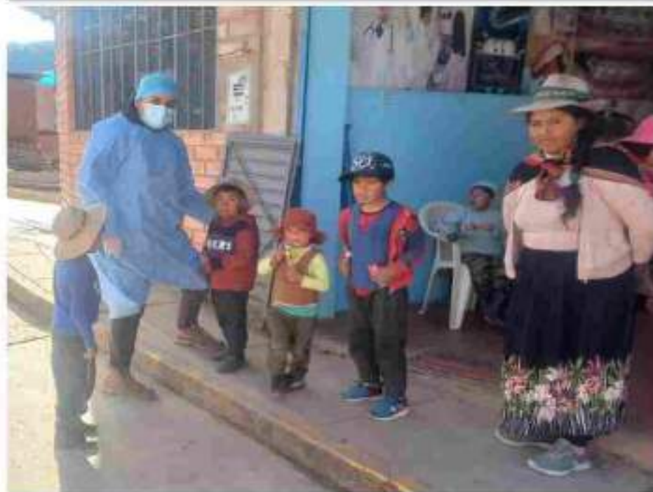
Equipo de protección personal (bioseguridad)