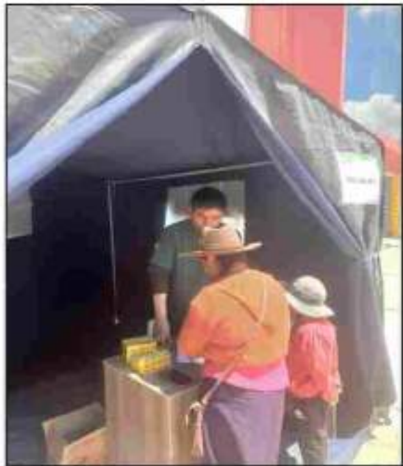
Llenado de listas de padres de familia seleccionados, y posterior evaluación y llenado de datos a los primeros padres de familia