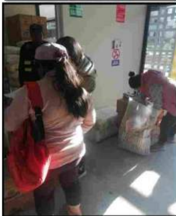
Local del Programa Vaso de Leche, distrito de Mara- Cotabambas y entrega de listas de Beneficiados al programa Vaso de Leche