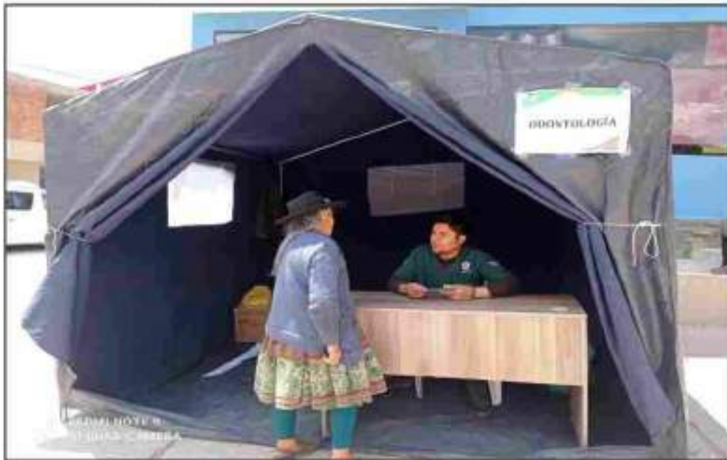
Encuesta a padres de familia y selección de niños que participaran en la pesquisa