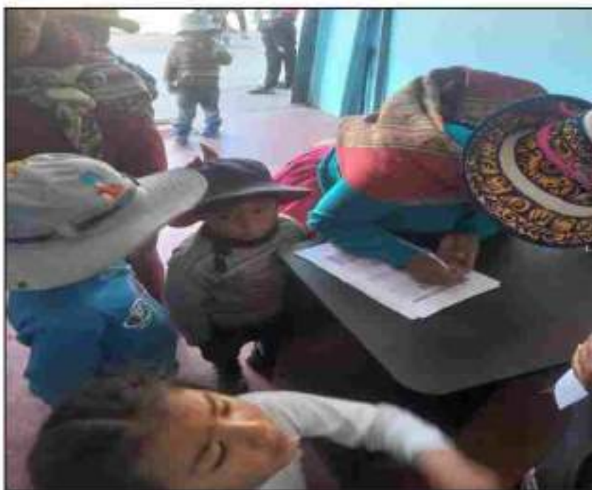
Reunión y firma de documentos del protocolo Cambra Modificado a padres de Familia de Familia participantes